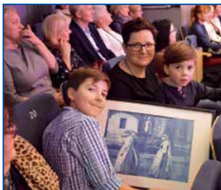
Licytacje cieszyły się sporym zainteresowaniem wśród uczestników koncertu