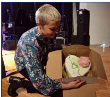
Jedną z licytowanych rzeczy był tort

Podczas zainicjowanej przez burmistrza spontanicznej zbiórki, zebrano 4000 zł.