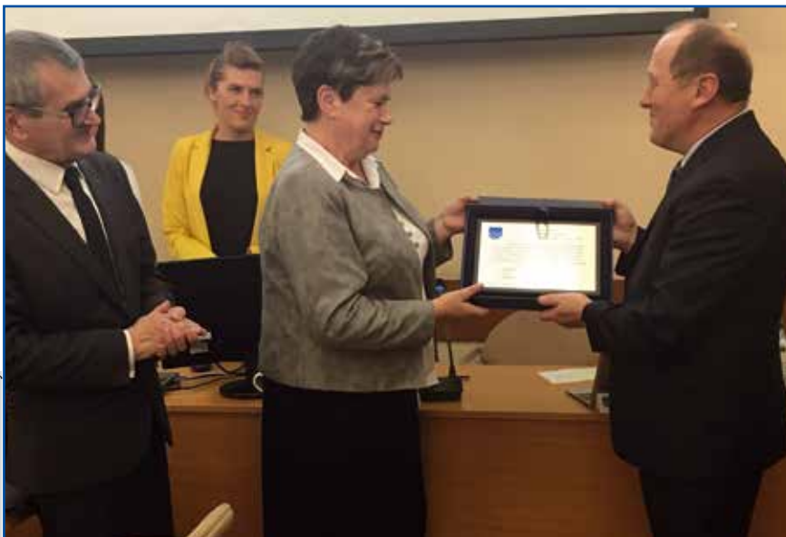
Fot. J. Posierbek, Koniczyny

profesjonalne prowadzenie spraw finansowych. Dzięki Pani doświadczeniu w tworzeniu i realizacji kolejnych budżetów w Mieście Łaziska Górne wybudowanych zostało wiele obiektów i oddano do użytku inwestycje, które przyczyniły się do poprawy warunków pracy i życia mieszkańców.