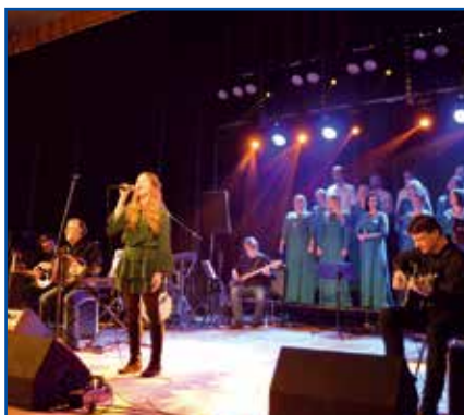
Występ zespołu Carrantuohill&AF MUSIC