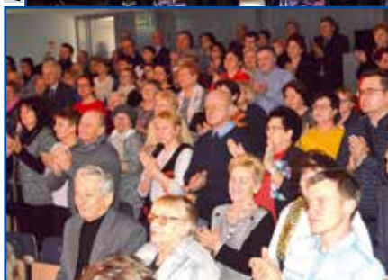
Owacje na stojąco dla mikołowskiej Harmonii