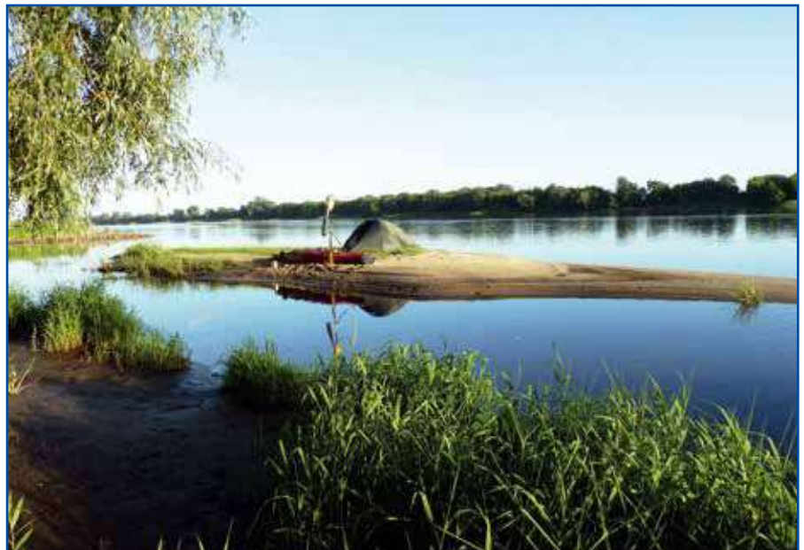
Łaziszczanin obozowiska rozbijał zazwyczaj na łachach piaskowych

dyś spałem gdzieś na brzegu, przyszedł do mnie sołtys i powiedział, że mam się niczego nie bać, że będą mnie pilnować. Nawet wyznaczili pana, który blisko mieszkał i miał mnie na oku. Innym razem, gdy wracałem z zakupów, zobaczyłem, że mój kajak został przesunięty, od razu pomyślałem, że mnie okradli. Ktoś jednak wyciągnął go jeszcze bardziej z wody na ląd. To byli członkowie klubu kajakowego Puławy. Zostawili mi też całe zaopatrzenie, wodę mineralną, tzw. paprochy, czyli zestaw kajakowy i piwa razem z pozdrowie-