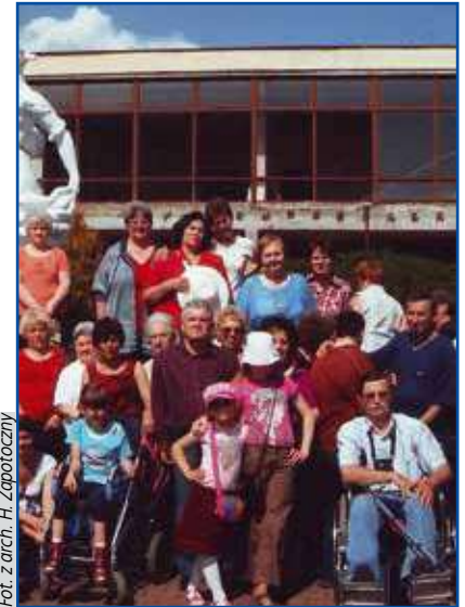
Białe Misie na wycieczce w Gogolinie