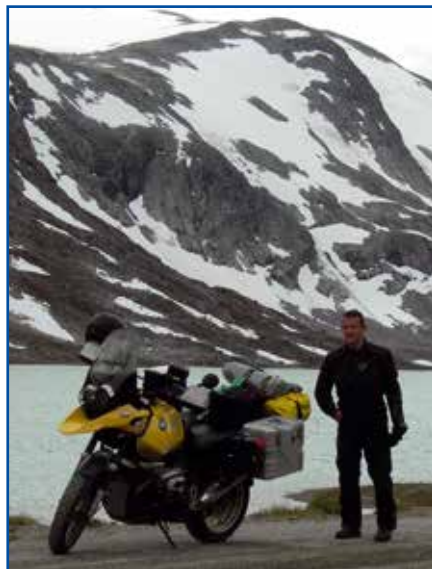
Podróż motorem na Nordkapp

Nieprzyjemnych sytuacji łaziszczanin miał niewiele, za to zyczliwości i bezinteresowności doświadczył sporo. Gdy kie-