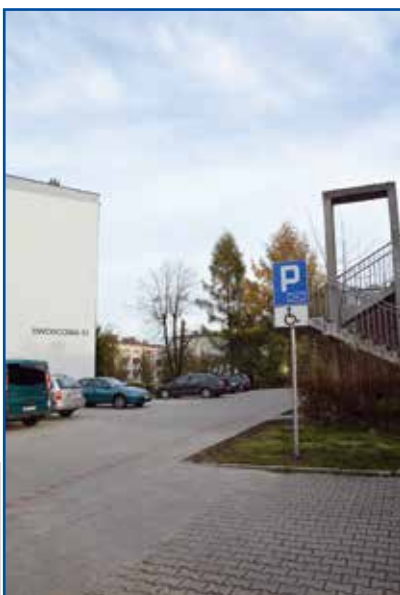
Parking przy P7 przy ul. Dworcowej